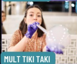
MULT TIKI TAKI