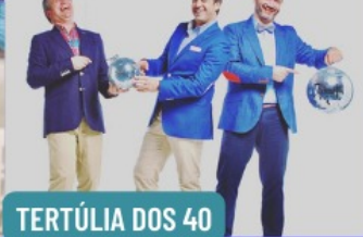
TERTÚLIA DOS 40