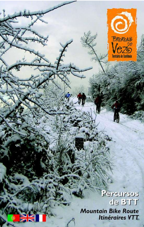
Proibida a Reprodução