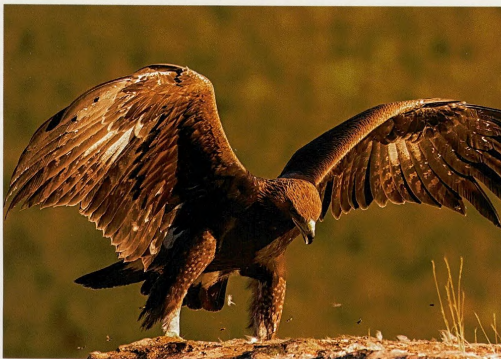
SOTERO JOSÉ Cerca de dois metros de envergadura de asa desta águia-real podem ter os seus inconvenientes. "Quando deparei com ela, quase me esquecia de fotografar", brinca o autor.